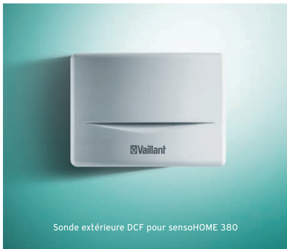
Sonde extérieure DCF pour sensoHOME 380

Couplé avec une sonde extérieure, optionnelle, sensoHOME anticipe les variations météorologiques et adapte en temps réel la température de départ de l'eau circulant dans le circuit de chauffage. Ainsi, vous garanteez à vos clients, la température souhaitée à tout moment.