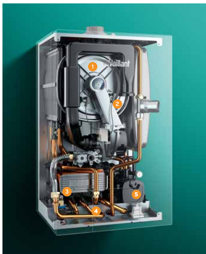
ecoTEC exclusive, vue intérieure aux rayons X.