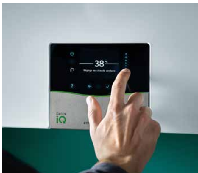
ecoTEC exclusive avec la passerelle sensoNET

ecoTEC exclusive est composée à 85 % de matériaux recyclables afin de réduire l'impact sur l'environnement. Elle est d'ailleurs labellisée Green iQ , un label créé par Vaillant pour valoriser les produits les plus performants, écologiques