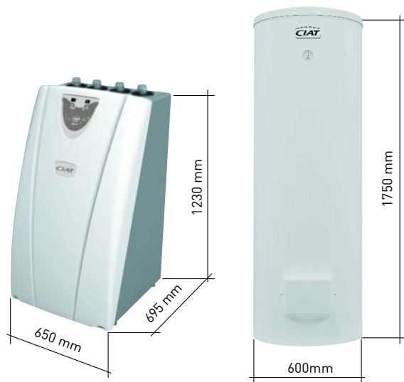
Option ECS ballon eau chaude SANI 300 litres