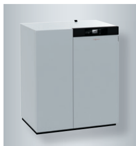
Vitoligno 300-C (de 18 à 48 kW) avec petit silo côté gauche