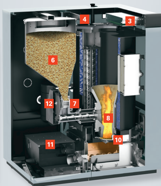
de 18 à 48 kW