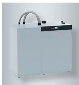
Vitoligno 300-C (de 8 à 12 kW) avec petit silo côté gauche pour un chargement manuel (capacité 260 kg)

La Vitoligno 300-C (de 8 à 12 kW) a obtenu le German Design Award WINNER 2015 pour son esthétique