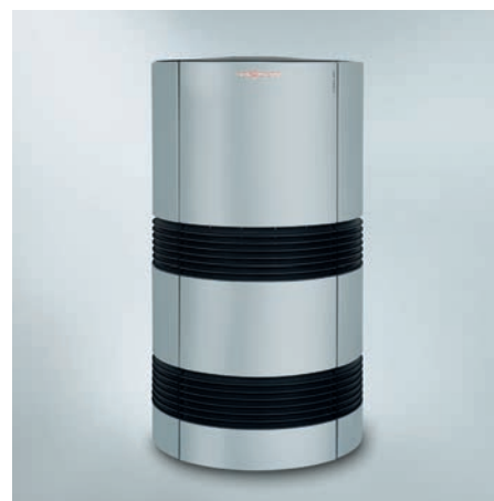
Vitocal 300-A pour une installation extérieure

Il est possible de réaliser des économies supplémentaires sur les coûts de fonctionnement en raccordant la Vitocal 300-A à une installation photovoltaïque. L'électricité auto-générée peut être utilisée par exemple pour le fonctionnement du compresseur, de la régulation, des circulateurs et du ventilateur de la Vitocal 300-A. De plus, la Vitocal 300-A est déjà prête pour le futur avec la compatibilité Smart Grid (réseau électrique intelligent).